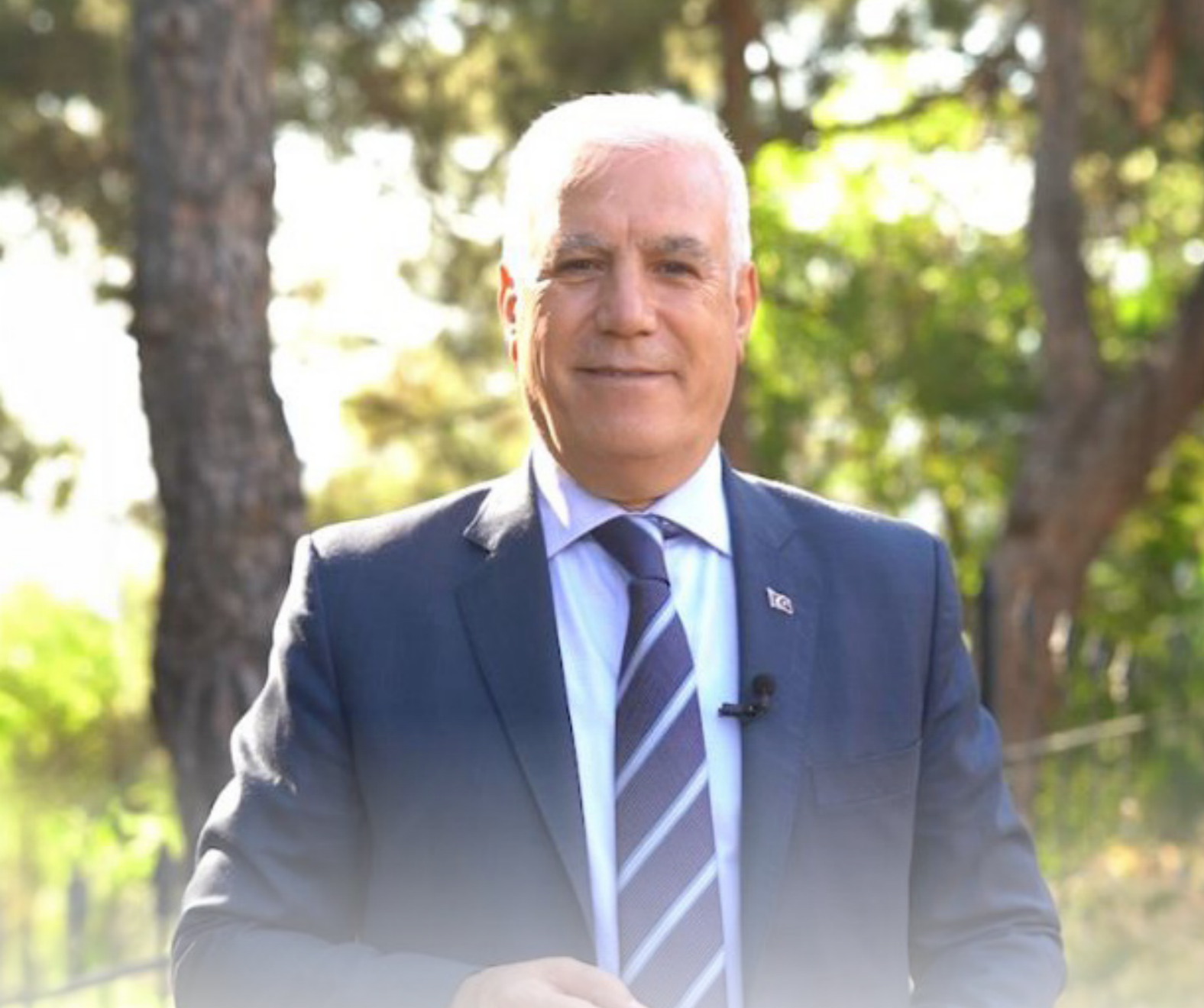
Mustafa BOZBEY Bursa Büyükşehir Belediye Başkanı